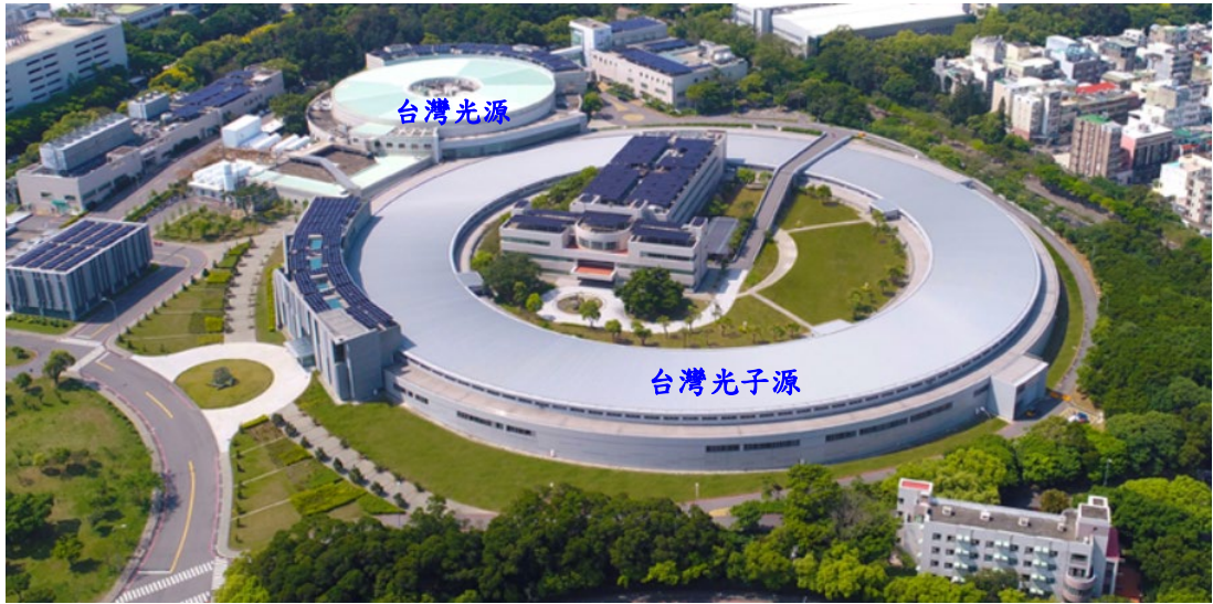
國家同步輻射研究中心光源設施鳥瞰圖

「國輻中心業務推動與設施管理計畫」係以「營造先進光源研發環境，健全光源實驗技術網，提供全方位光源科研服務」為中長期發展目標，並依據「中華民國科學技術白皮書(112 至 115 年)」第六節、共通性策略，第一大項科研體制策略(二)深化科研體制的基礎架構之「1. 善用公共科研機構，支持前瞻技術發展」、以及第三大項人才培育策略(一)「2. 厚植科研能量與培育基礎科研人才，強化人才的跨領域整合」等政策，以及國科會 113 年度施政計畫「目標二、深耕基礎卓越研究，推升研發成果創新價值」之「(二) 整合共用設施平台，擴大研發服務量能，創造前瞻科研成果」，本計畫配合發展與穩定運轉大型核心光源設施，提升共用實驗設施平台運作效率，擴大產學研之服務量能，爰擬定「加速器設施發展」、「光束線實驗設施發展」、「科學研究推廣」、「產業服務與應用」四大主軸，據以規劃研擬相關推動策略與行動方案。各項主軸之推動策略與行動方案分述如下：