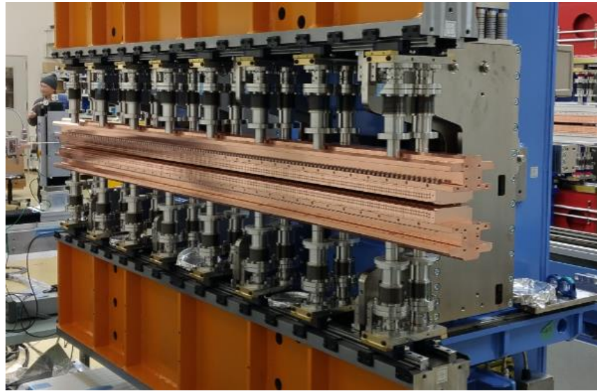
圖 1 CU15 機械工程結構