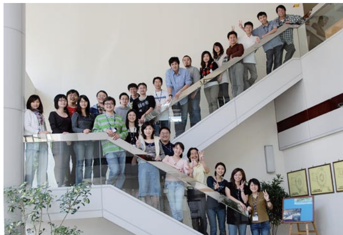
參加蛋白質結晶學冬令學校之學員於儲存環館門口前合影

在短短5天的訓練中，學員除了學習蛋白質結晶學基本知識之外，必須親自培養晶體、收集及處理單晶繞射數據，並利用S-SAD方法解析出晶體之結構。所有學員在3天的努力學習與課程實作後，皆能以自己培