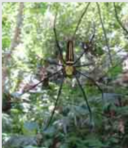
(人面蜘蛛小憩樹叢裡)